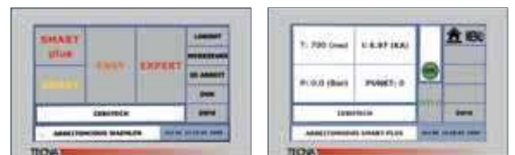
Einfache Bedienung und Programmwahl über Touchscreen